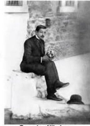
Georgios Nikolaou Papanikolaou 1883-1962

" Diagnosis of Uterine Cancer by the Vaginal Smear "(1943)